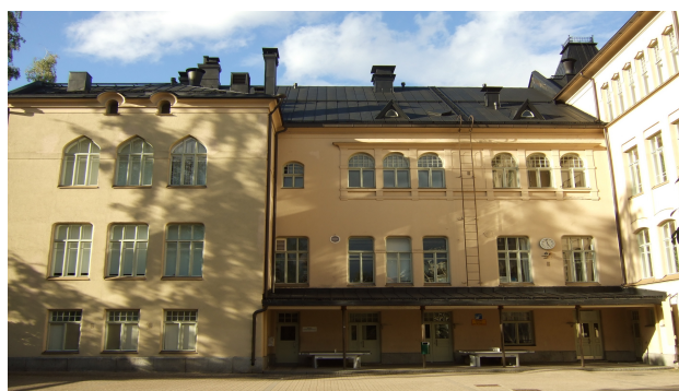
collège formant avec le primaire l'école fondamentale Wivi Lönni

Beaucoup plus au nord.... au niveau du cercle polaire on est en train de créer une Alliance française. Les francophones de Rovaniemi et les services de l'ambassade attendent avec impatience l'ouverture de cette institution qui bénéficiera aux habitants de Laponie . La bibliothèque sera à la disposition des élèves des écoles et de l'alliance et permettra la mise en place d'ateliers de lecture.